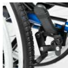
Freno de aluminio