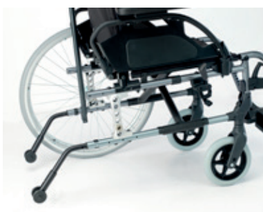
Sistema doble amputado