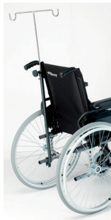
Soporte de gotero