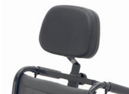
Reposacabezas de skay