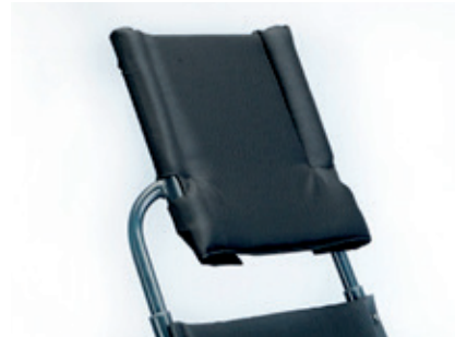
Reposacabezas de tela para modelo con respaldo reclinable