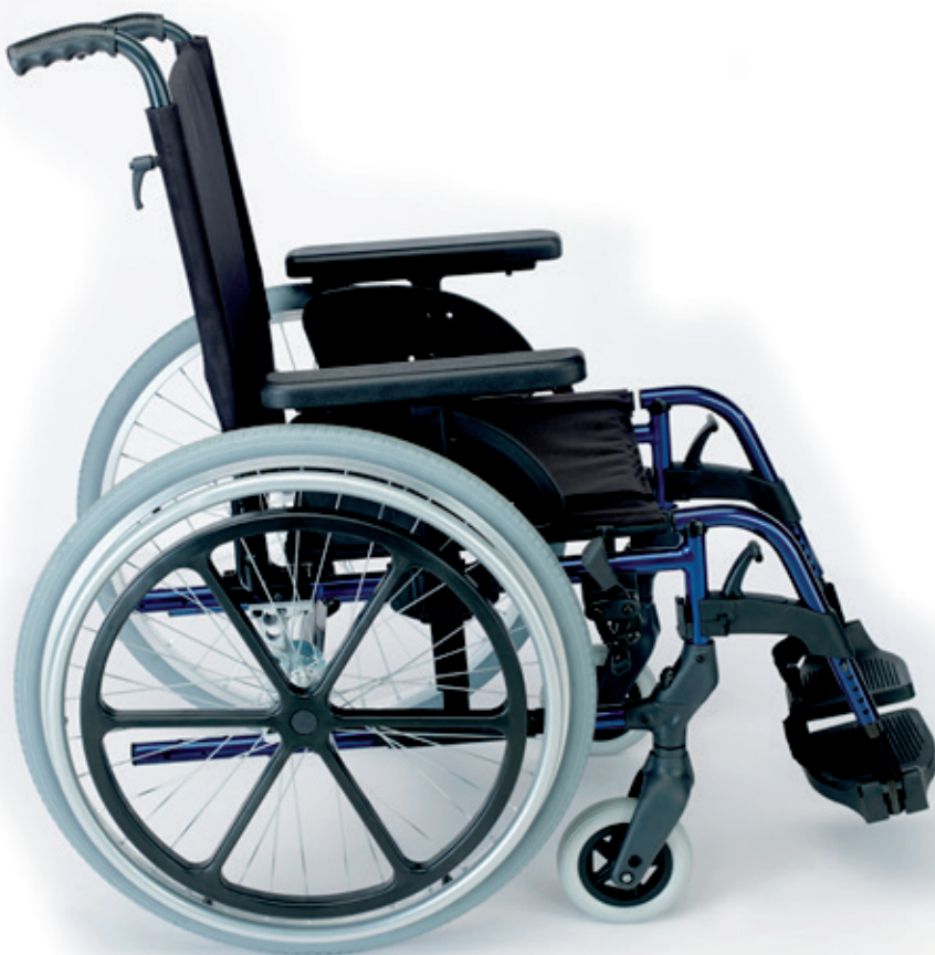
Sistema de hemiplejía