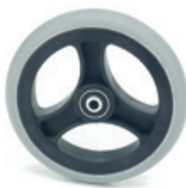
Ruedas delanteras de 6" macizas