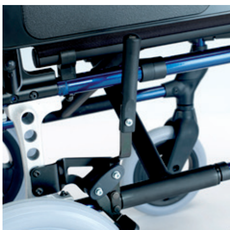
Alargador de freno