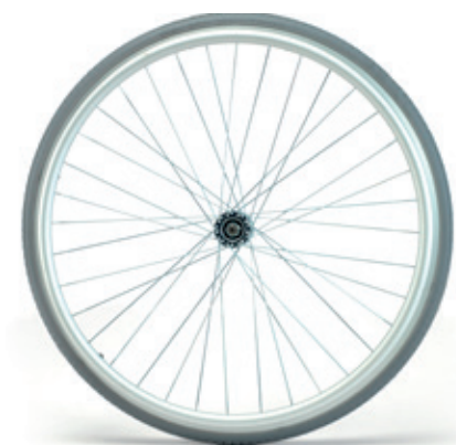
Diferentes opciones de ruedas traseras: de 22" o 24", con radios, Sport, neumáticas, macizas