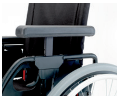
Reposabrazos ajustables en altura