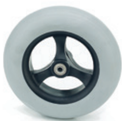
Ruedas delanteras de 8" x 2" macizas