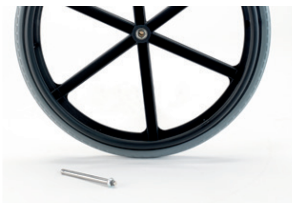
Eje de desmontaje rápido para ruedas traseras