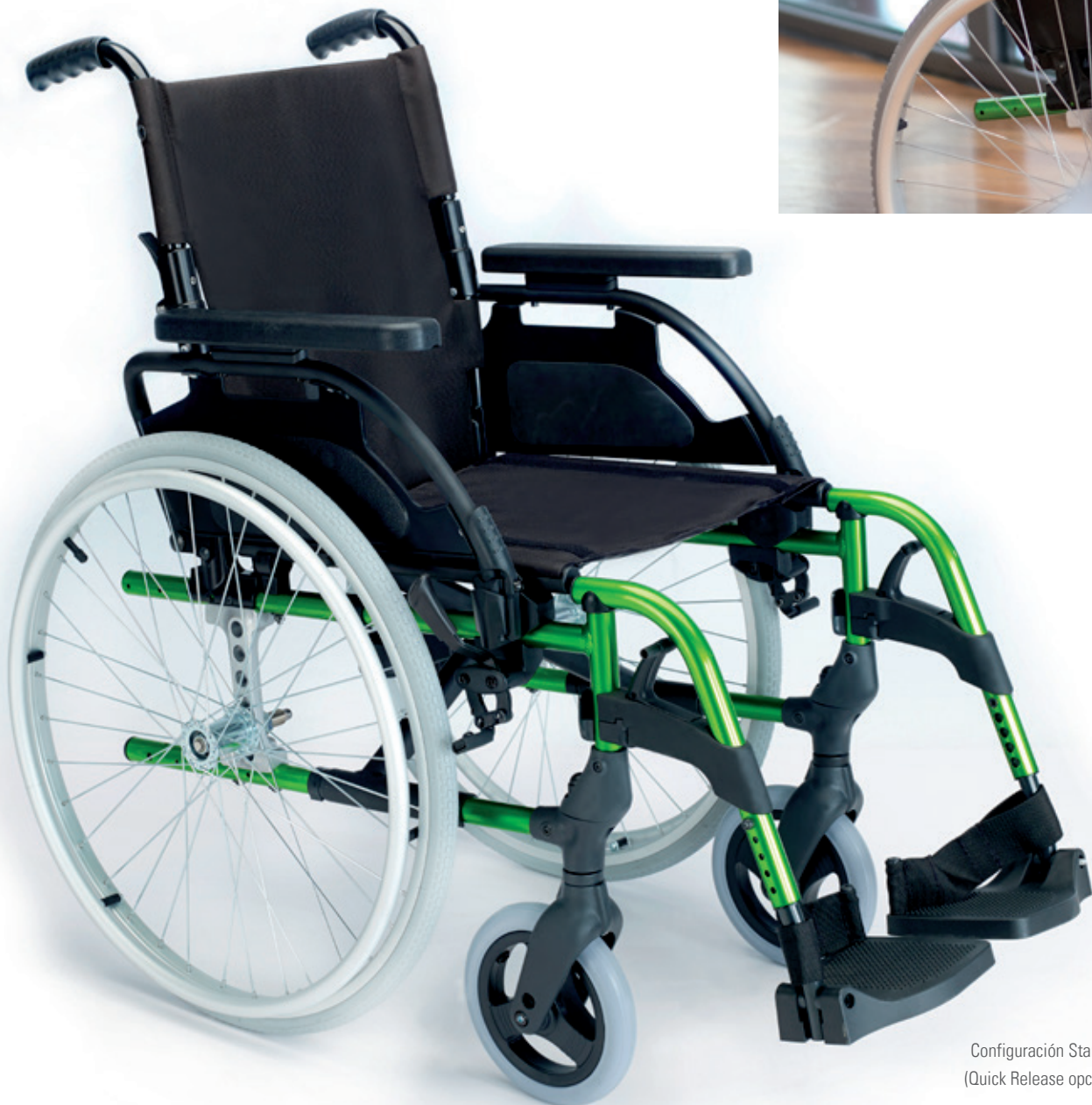
Configuración Standard (Quick Release opcional)