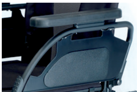
Robustas fijaciones del reposabrazos al armazón, sin holguras