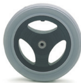
Ruedas traseras de 12" (neumáticas o macizas)