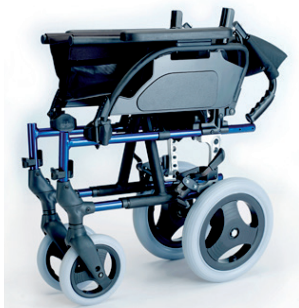
Breezy Style con respaldo partido, plegada

Breezy Style es la solución para usuarios y acompañantes que buscan una silla standard lo más ligera posible. Gracias a su chasis de aluminio, Breezy Style tiene un peso de transporte reducido y además se pliega fácilmente para poder llevarla sin esfuerzo a cualquier sitio.