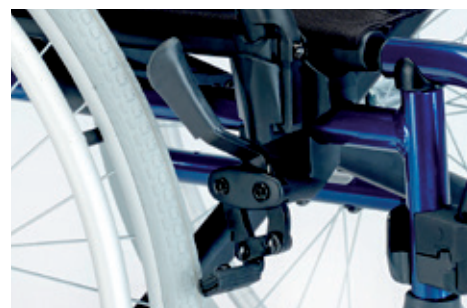
Freno eficiente con empuñadura ergonómica de fácil acceso