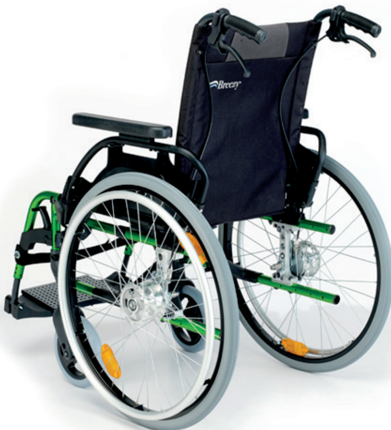
Frenos de tambor para rueda de 24"