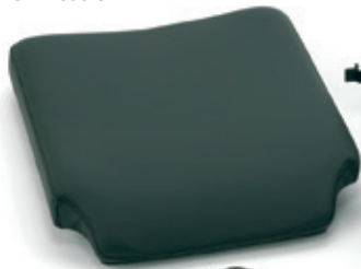
Asiento anatómico sin inodoro