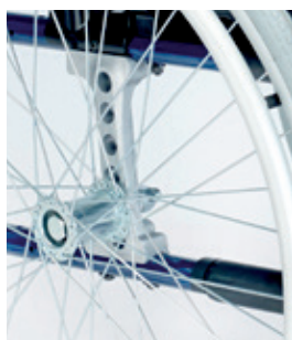
Pletina trasera del eje de aluminio

¡Y aún hay más! La pletina del eje de aluminio y la cruceta tubular , sin tornillos ni anclajes, dotan a la silla de una gran resistencia y rigidez para poder disfrutar de ella como el primer día, durante mucho tiempo. Y estamos tan seguros de ello, que te ofrecemos ¡5 años de garantía en la estructura y cruceta!