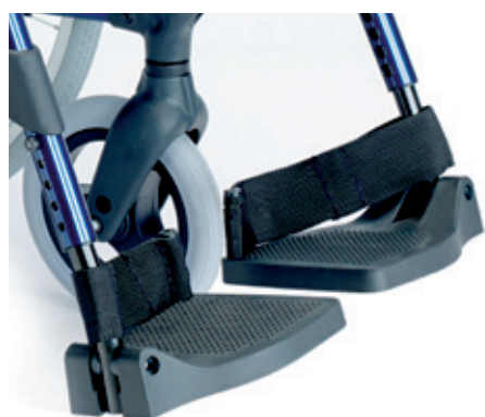
Gran firmeza de las plataformas para garantizar un ángulo correcto de los pies.