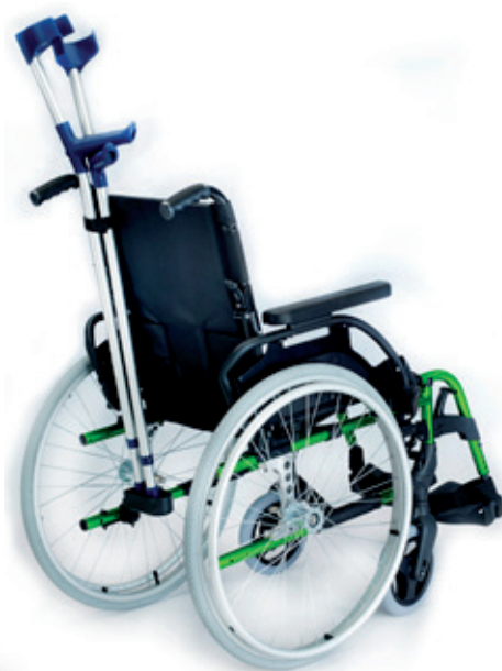
Soporte de bastones