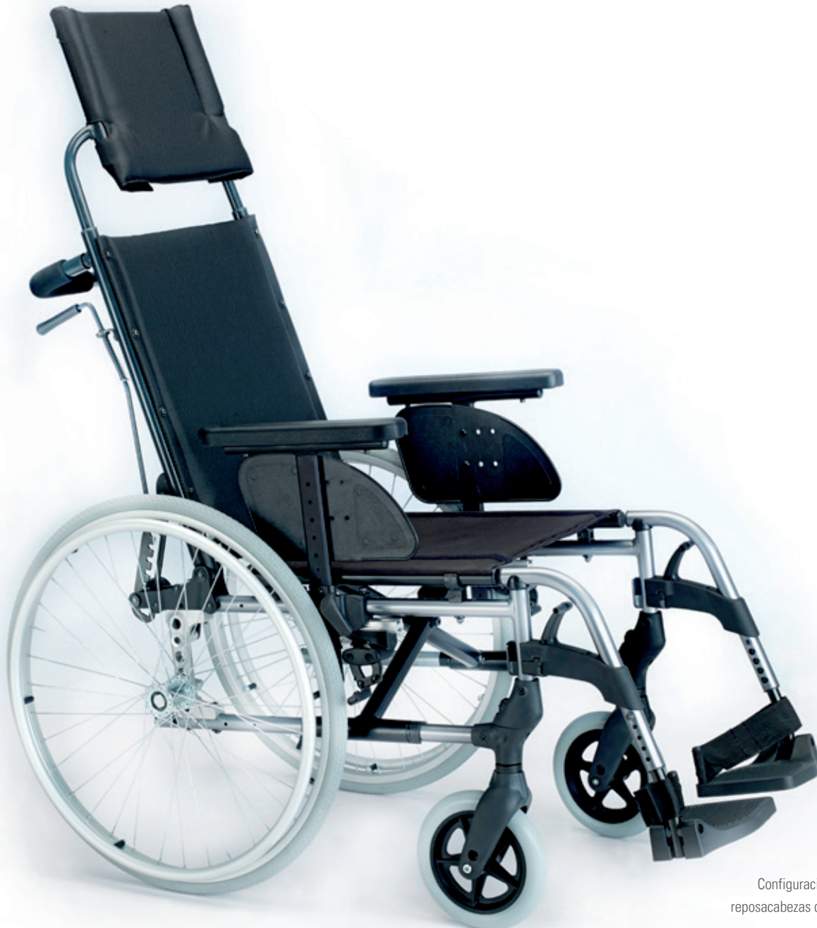
Configuración Standard con reposacabezas de tela (opcional)