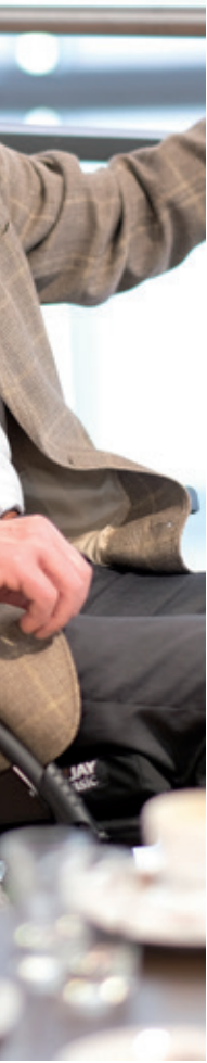
Breezy Style con respaldo partido, plegada