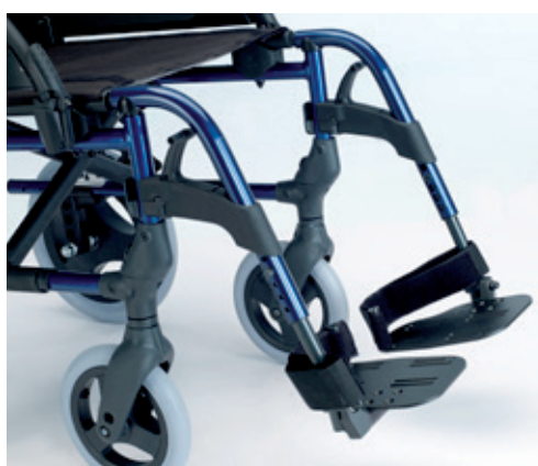
Plataformas de aluminio regulables en ángulo