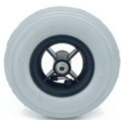
Ruedas delanteras de 8" x 2" neumáticas