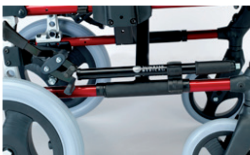
Bomba de inflado