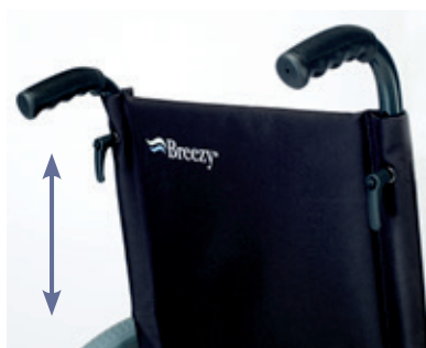
Empuñaduras ajustables en altura